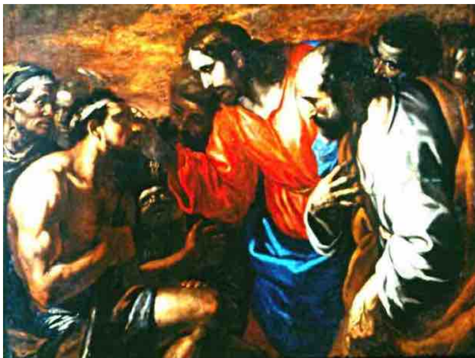
Die Heilung des Blindgeborenen (vgl. Joh 9, 1 – 41)